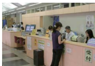
○諸証明などの発行窓口

●お問い合わせ先/福岡市市民局総務部施設整備担当 TEL/092-711-4848