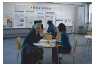
○自由に語らえるフリースペース