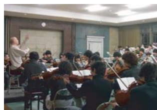
○大・中・小の練習場を整備