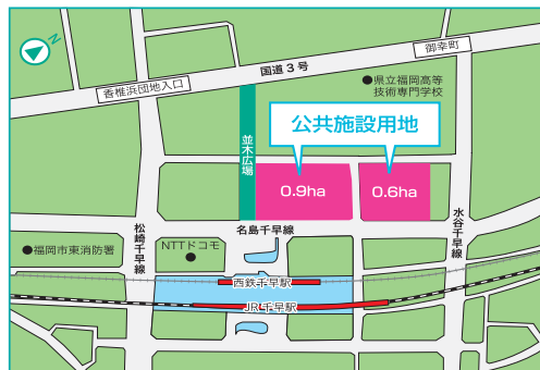
○千早駅前地区の現況図