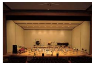
○約800席の多目的ホール